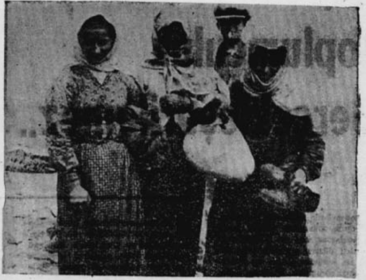
Fındık toplayan, çile dolduran Karadeniz kadınları

Halil AYTEKİN, PİRAZİZ köyündeki incelemesinin bu bölümünde, Ağaların gelir giderlerini belirtiyor