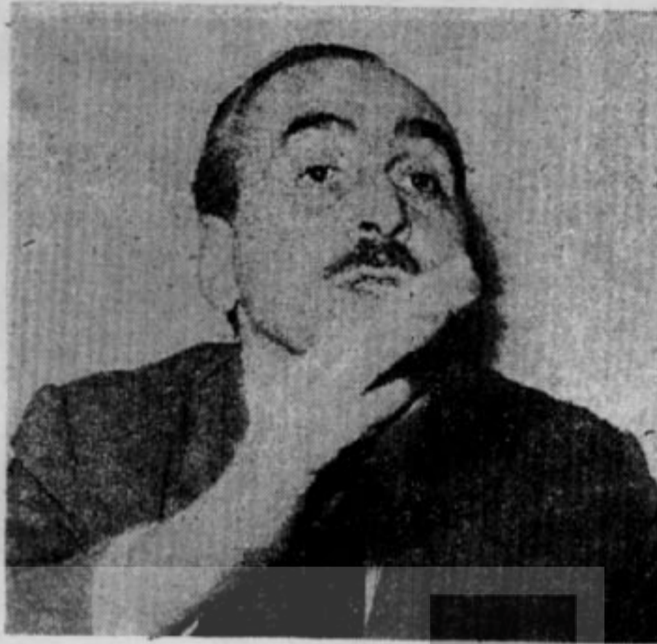
T. İ. P. Genel Başkanı M. Ali Aybar (Anayasanın Savunucusu)

Hükümet «açık rejim» içinde Adeta kapalı iş görüyordu. Ortak Pazarla olan münasebetleri safhaları ile halk oyuna sunmuyor, tartışılmasına yanaşmıyordu. Hükümet kısa vadeli bir iş sayıyordu Ortak Pazara girmeyi. Bazı ihracat mallarına müşteri bulununca işler kolaylaşacak sanıyordu. Oysa Türkiye plânla muasır medenî yet seviyeye ulaşmağa mecburdu. Ortak Pazar, Türkiye'nin bu amacına yardım yapacak mıydı?