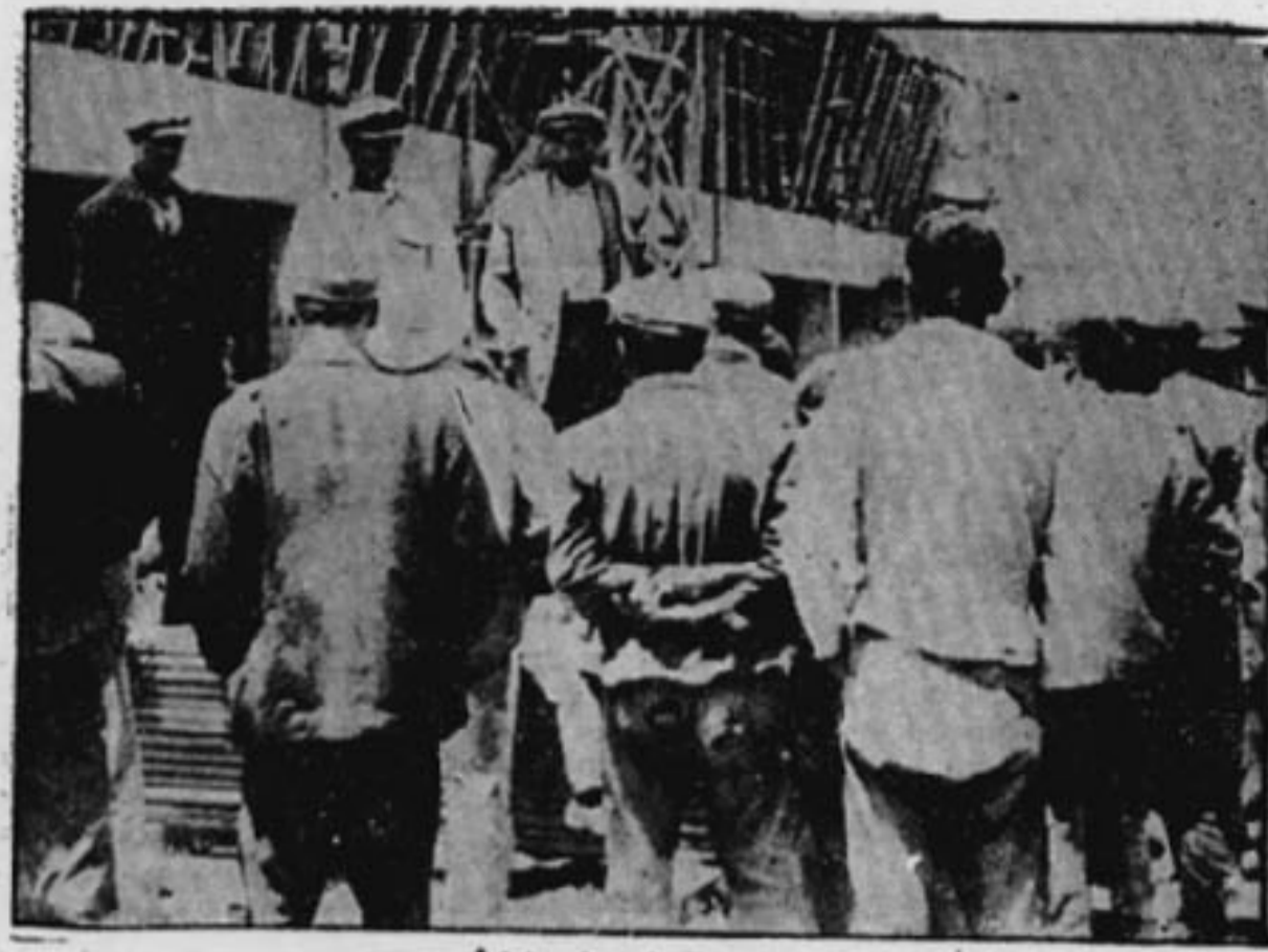
— İş bırakan işçiler — «Ben senin babanın uşağı değilim.»

İşçi—İşveren münasebetleri bakımından yeni bir düzene girmekte olduğumuz belli. «Duyduk demeyin,» diye dosta, düşünene açıkladı bu gerçeği Kavel olayı.