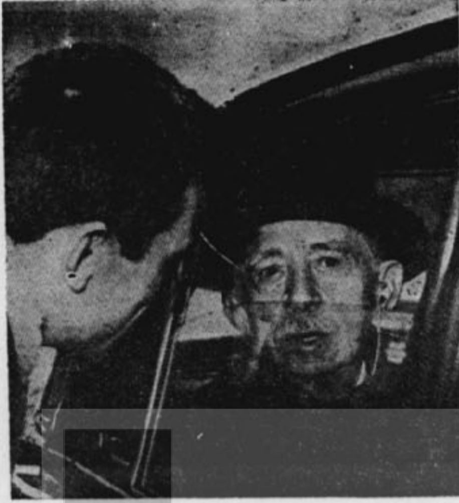
Başbakan İnönü ve gazeteci (Yeni bir şey var mı?)

Gerçekte bu tedbirler de halk kütlelerinin beklediği sonucu vermeyecekti. Bir kısım CHP li ve koalisyon kanadına girmiş partilerin «ikbal» cillerine sandalyalar sağlanacaktı. Bakan sayısına yenilerinin eklenmesini, Bakanlara yardımcılar verilmesinin zorunlu olduğunu anlatan Başbakan, bu yeni bürokratik ameliyenin halk kütlelerine ne getireceğini anlatmıyordu. Demokrasi her şeyin hal kın önünde konuşulup tartışılması, halkın eğilimlerine önem